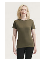
SOL'S REGENT WOMEN 01825